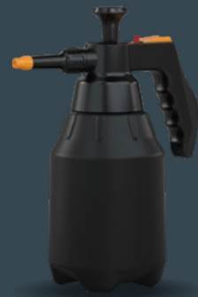
Master 1.8 L Acid+