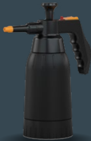
Master 1.2 L Acid+