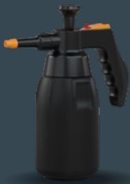
Master 1.0 L Acid+