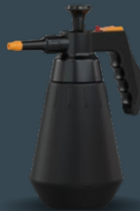
Master 1.5 L Acid+